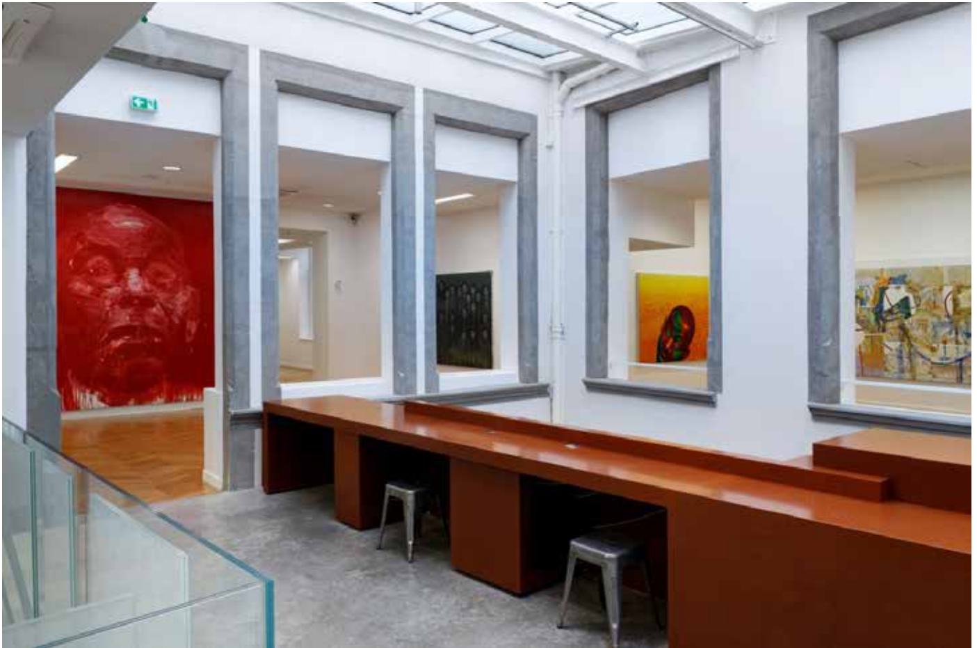
Exposition A quoi tient la beauté des étrointes - La collection du FRAC Auvergne - Janvier-mars 2016

Créé en 1985, le FRAC Auvergne est une institution soutenue par le Conseil Régional Auvergne-Rhône-Alpes, la DRAC Auvergne-Rhône-Alpes, la ville de Clermont-Ferrand et par un Club de Mécènes réunissant une quinzaine d'entreprises régionales.