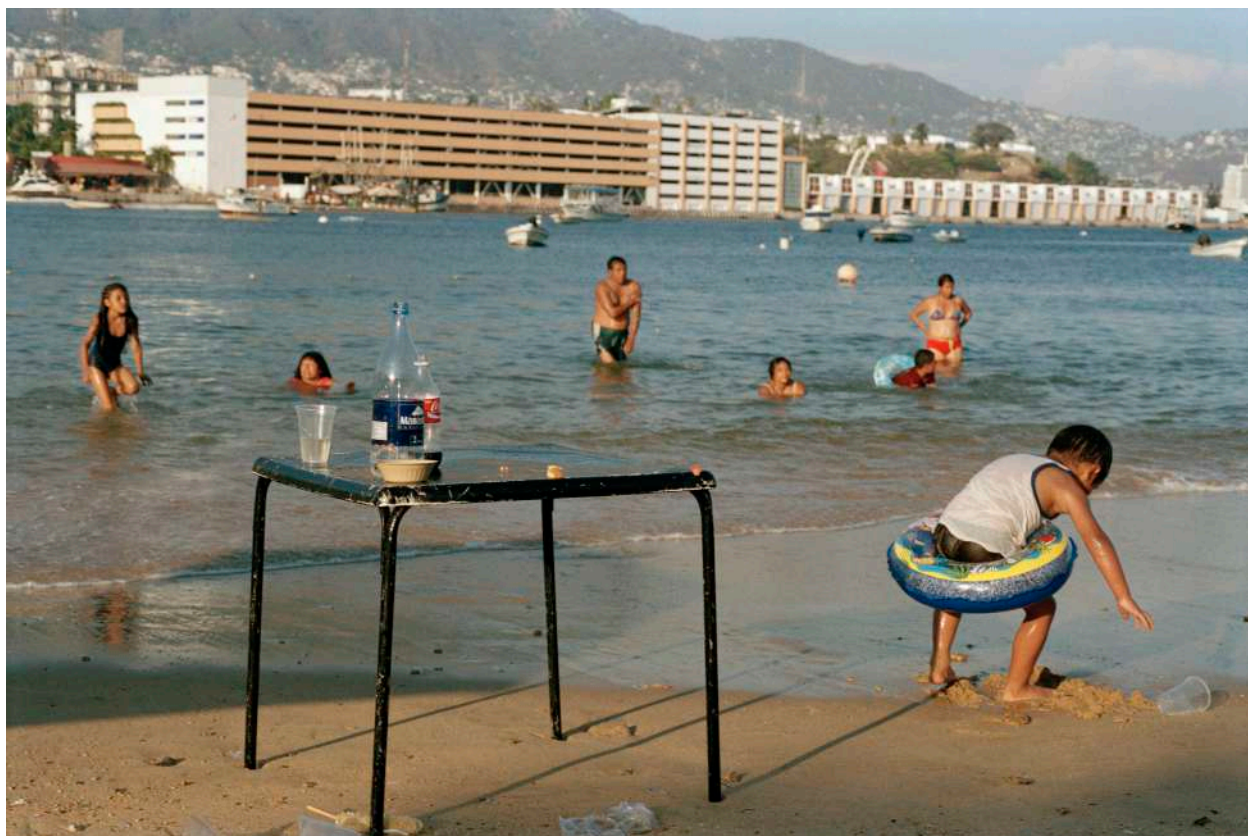
The Town Beach, Acapulco, Mexico, 2008.