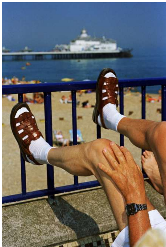
Eastbourne, England, 1995-1999.

Le photographe Martin Parr est l'invité d'été de l'Hôtel Fontfreyde – centre photographique de Clermont-Ferrand jusqu'au dimanche 22 septembre 2019.