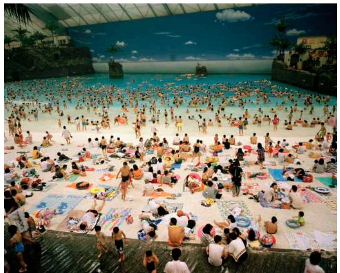
The Artificial beach inside the Ocean Dome, Miyazaki, Japan, 1996.

Martin Parr a développé récemment un intérêt certain pour la réalisation cinématographique. Il explore par ailleurs de nouveaux univers tels que ceux de la mode et de la publicité et a participé à d'importantes expositions et festivals internationaux : directeur artistique invité des Rencontres d'Arles en 2004, commissaire de l'exposition New Typologies au New York Photo Festival en 2008 et commissaire invité de la quatrième Biennale de photo de Brighton. En 2017 Martin Parr ouvre sa fondation à Bristol.