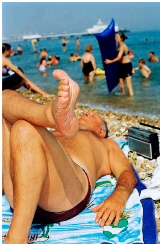
Eastbourne, England, 1995-1999.

Le centre photographique participe aussi à la promotion des artistes et de leur œuvre par le biais d'un centre de documentation et de nombreuses actions originales de médiation et de sensibilisation des publics. L'Hôtel Fontfreyde - centre photographique est membre du réseau national Diagonal depuis 2017.