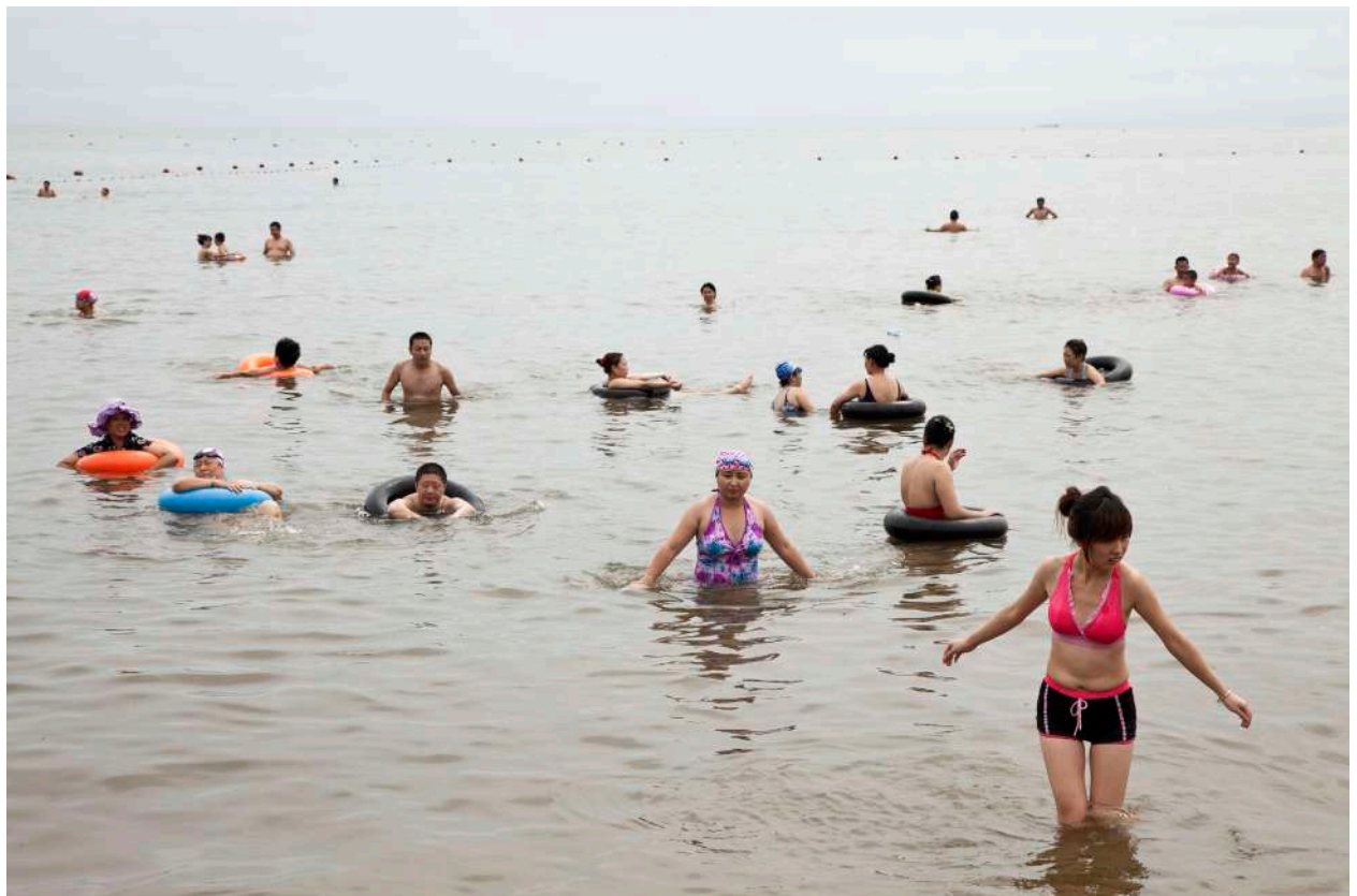
Beidaihe, Qinhuangdao, China, 2010.

Remerciements au FRAC Auvergne et à la Collection agnès b pour le prêt d'oeuvres qui viendront en accompagnement de cette présentation, dans la salle 2 de l'Hôtel Fontfreyde - Centre photographique