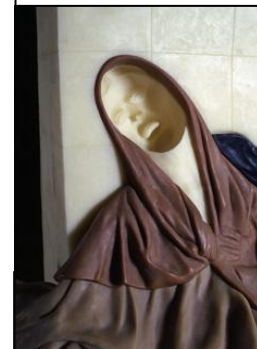
2001-2002, Cire polychrome, 220x250x40 cm, collection Mudam