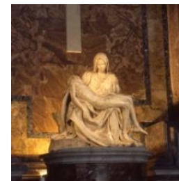
MICHEL-ANGE (1475-1564) Piéta - 1498 - Marbre - Rome, Basilique Saint Pierre.

http://www.pascalconvert.fr/histoire/madone_de_Bentalha/madone_de_bentalha.html