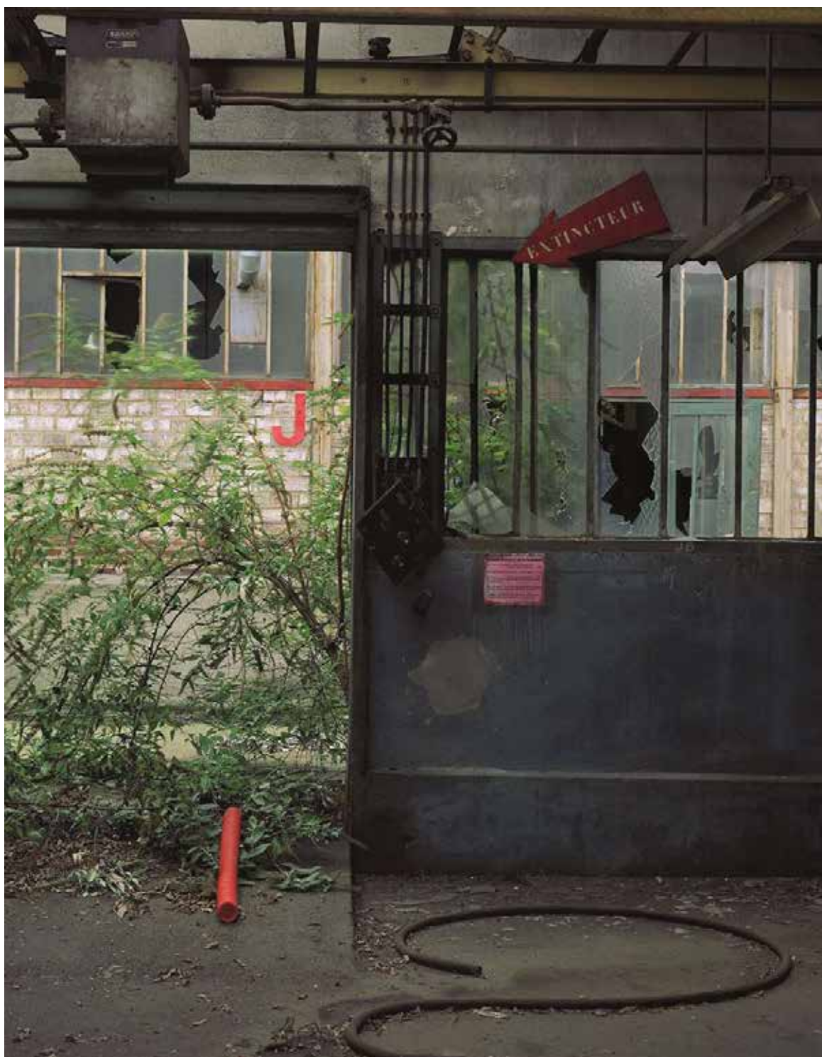
Stéphane Couturier - Usine Gévelot à Issy-les-Moulineaux - 1996 - Tirage chromogène - Éd.4/5 - 80 x 60 cm Collection FRAC Auvergne - Donation Robelin