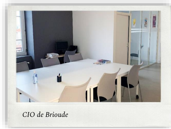
CIO de Brioude