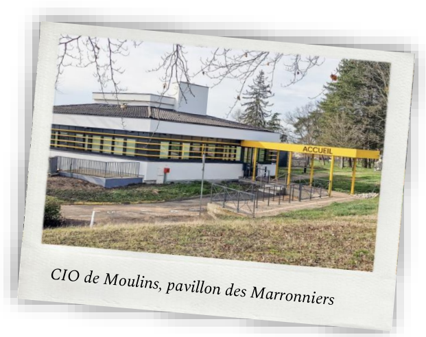
CIO de Moulins, pavillon des Marronniers