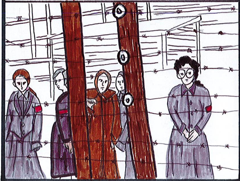
Elle sera déportée au camp de Ravensbrück par le transport parti de Paris-Romainville le 13 mai 1944.