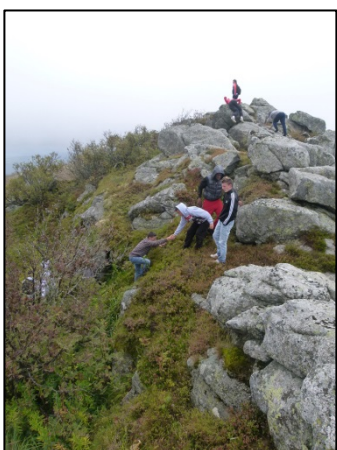
Des sorties découverte de la biodiversité

Les actions « écocitoyennes » sont fortement représentées dans les actions entreprises. Parmi celles-ci, la plupart visent à une meilleure maîtrise de la consommation d'eau, à une consommation raisonnée des aliments ou du papier ou à une sensibilisation aux tris et au compostage. Par exemple, dans le domaine des économies d'énergie, cinq établissements (deux collèges et trois lycées) ont entrepris des actions concrètes.