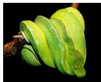
Morelia viridis . Source : Wikipedia