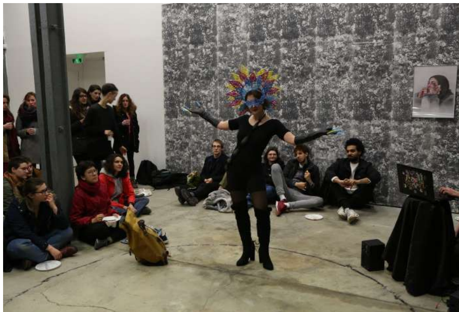
Performance, 19ème édition des Enfants du Sabbat , 2018.

Dans la veine des 19 dernières éditions des Enfants du Sabbat , expositions collectives qui n'ont eu de cesse de mettre en avant le travail des jeunes générations d'artistes, le Creux de l'enfer invite une douzaine de jeunes diplômés issus de différentes écoles des beaux-arts à investir l'ensemble des espaces d'exposition du centre d'art et de l'Usine du May, centre culturel voisin.