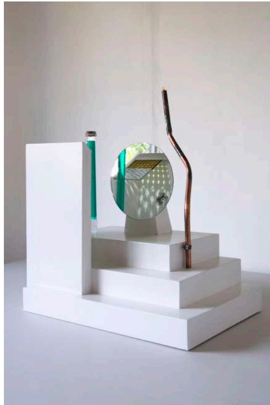
Le dos de la coiffeuse © Pauline Toyer

Se posant inlassablement la question du point de vue et de la perception de ses œuvres sculpturales, Pauline Toyer déploie dans la Grotte Le dos de la coiffeuse , une petite sculpture perchée au creux de la roche qui disperse les indices d'une narration à recomposer.