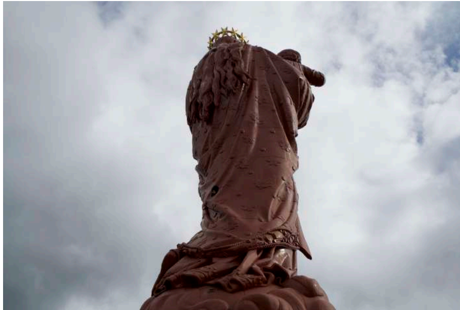
La statue de Notre-Dame de France au Puy-en-Velay

Exposition associée à la 15ème Biennale de Lyon