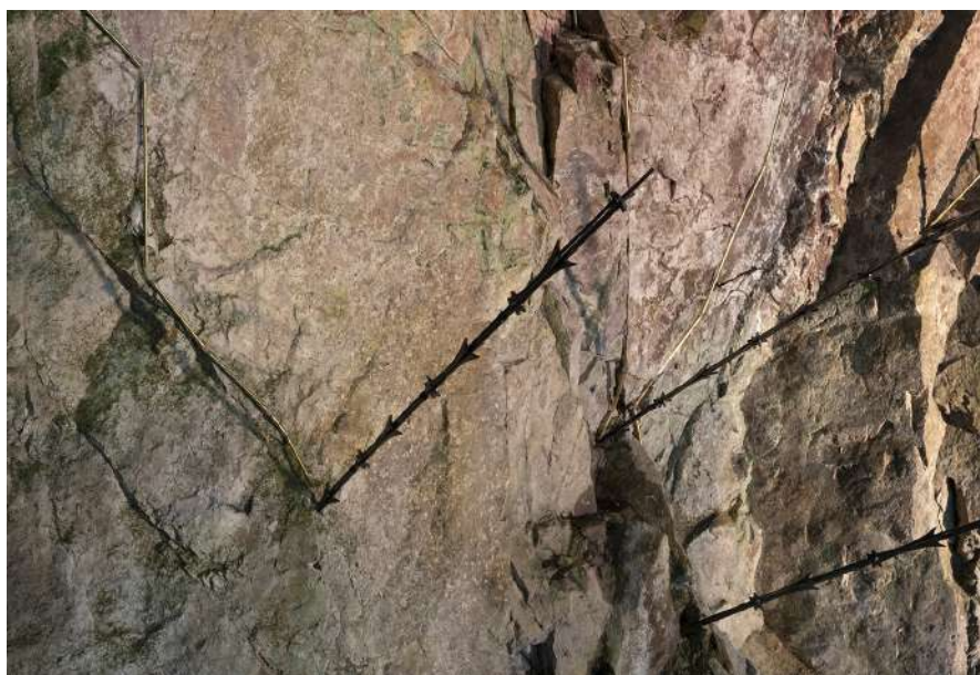
Charlotte Charbonnel, Nucleus , 2019.

Exposition principale : Charlotte Charbonnel