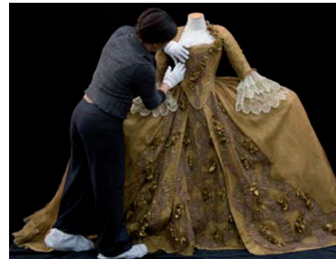
Mannequinage de costume