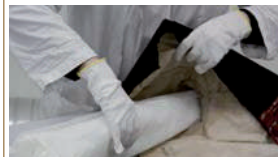
Conservation préventive