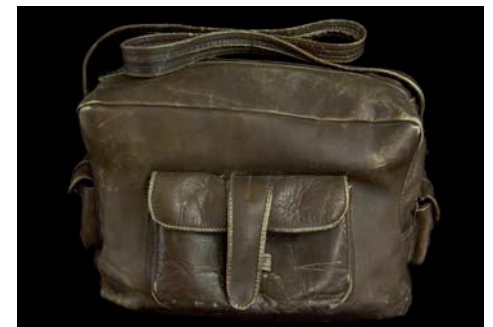
Sac de voyage, Collection Noreev

Le dossier pédagogique de chaque exposition rend lisible les différentes références possibles avec les 6 domaines de l'Histoire des arts : arts du visuel, arts du son, arts du quotidien, arts du spectacle, arts de l'espace et arts du langage.