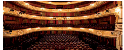
La Comédie-Française, salle Richelieu