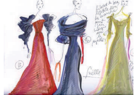
Actéon, 2001, Coll. Christian Lacroix