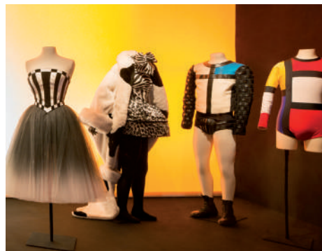
Exposition Modes ! A la ville, à la scène !

Privilégier d'abord une approche sensible (lieu, atmosphère...) avant l'approche analytique (identification des œuvres).