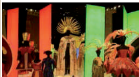
Exposition Barockissimo, Les arts florissants en scène , salle Les Indes Galantes