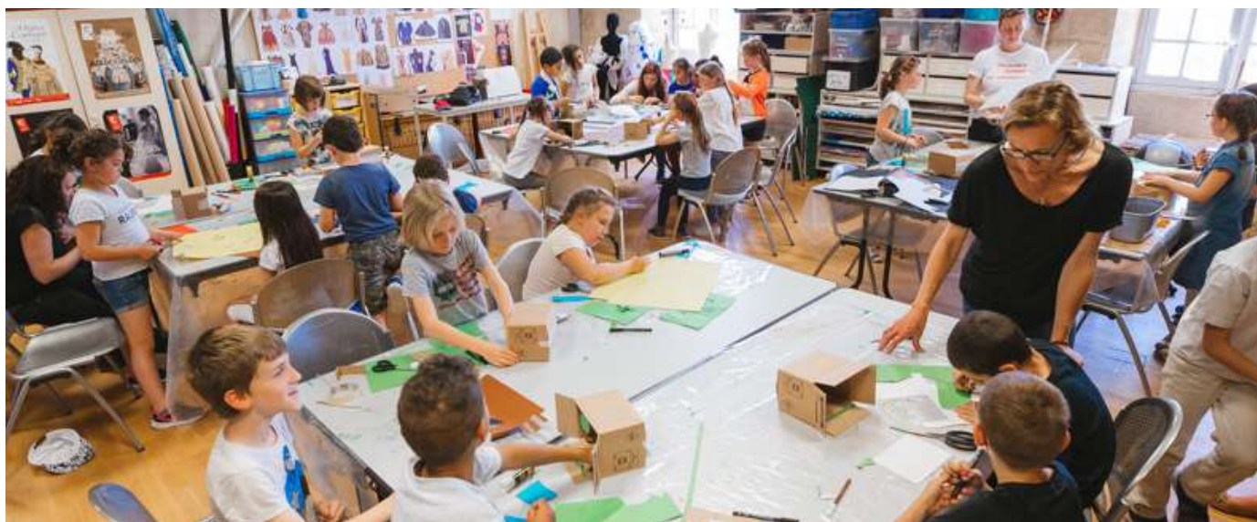
Atelier de pratique artistique

Le bâtiment, les scénographies originales, les costumes comme véritables œuvres du patrimoine culturel, les ateliers de pratique artistique, les fonds documentaires, font du CNCS un lieu particulièrement riche où l'approche sensible se mêle aux connaissances théoriques.