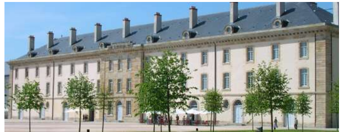
CNCS Moulins Communauté

Que ce soit au travers des enseignements suivis, de projets spécifiques, d'actions éducatives, le Projet d'Education Artistique et Culturelle (PEAC) se fonde sur trois champs d'action indissociables : des rencontres avec des artistes et des œuvres, des pratiques individuelles et collectives dans différents domaines artistiques, et des connaissances qui permettent l'acquisition de repères culturels ainsi que le développement de la faculté de juger et de l'esprit critique.