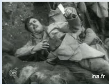
Des soldats se préparent dans une tranchée à lancer une offensive contre l'adversaire

La confrontation du 1 er extrait à un extrait de 1918 montre l'évolution du discours autour du corps meurtri. Les reportages de 1914 sont des reportages reconstitués et mis en scène. La dimension brutale de