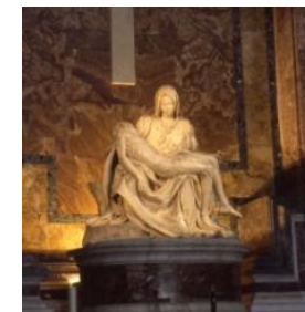
MICHEL-ANGE (1475-1564) Piéta - 1498 - Marbre - Rome, Basilique Saint Pierre.

http://www.pascalconvert.fr/histoire/madone_de_Bentalha/madone_de_bentalha.html