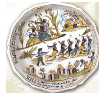
Saladier aux esclaves 1785 - Faïence de Nevers polychrome - Diamètre : 34,5 cm - Musée du Nouveau Monde, La Rochelle